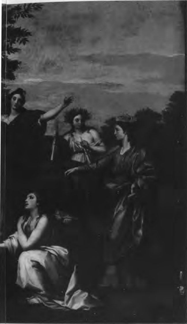
Ci-contre, Le Parnasse, par Anton Raphaël Mengs, (1760-1761).

La composition ci-dessus, de Mengs, place au centre Apollon, dieu de la musique et des arts, et Mnémosyne, assise, entourés des neuf muses. Mnémosyne était la déesse de la mémoire. Elle fut aimée de Zeus et donna naissance à neuf muses représentant les arts : Calliope (poésie épique), Clio (histoire), Érato (poésie lyrique), Euterpe (musique), Melpomène (tragédie), Polymnie (rhétorique), Terpsichore (danse), Thalie (comédie), Uranie (astronomie).